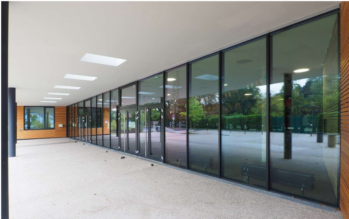
Légende : Ecole Européenne – Strasbourg – Architectes : Auer Weber avec DRLW Strasbourg