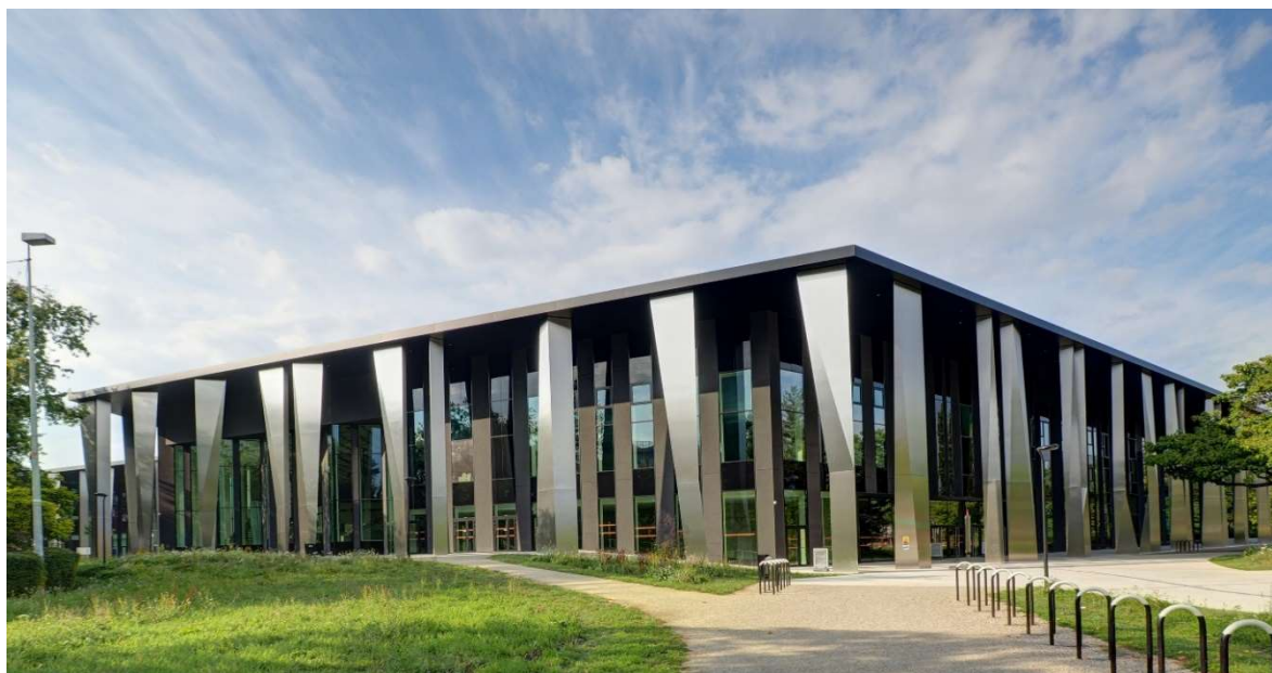
Légende : Palais de la musique et des congrès de Strasbourg – Architectes mandataires : Rey-Lucquet et associés atelier d'architecture, architectes associés : Dietrich I Untertrifaller architectes