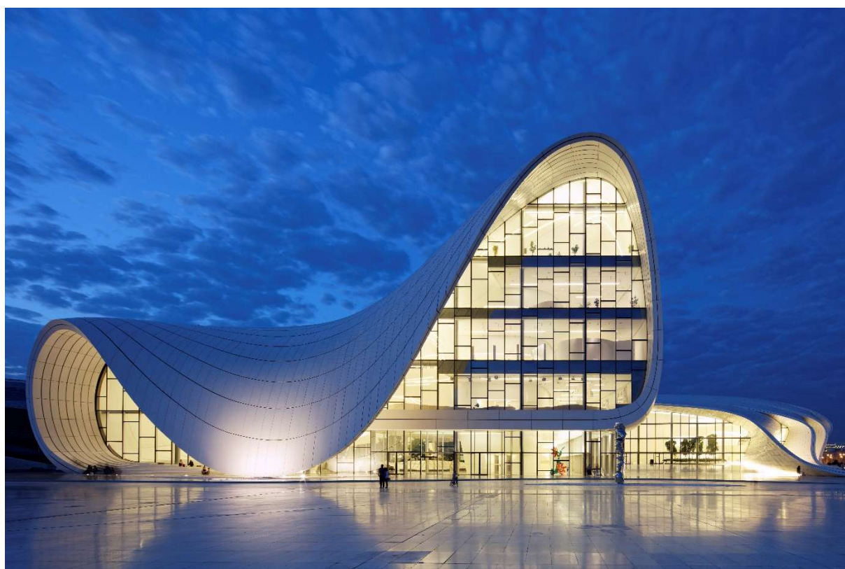
Légende : HEYDAR ALIYEV CULTURAL CENTER BAKU - Hueck