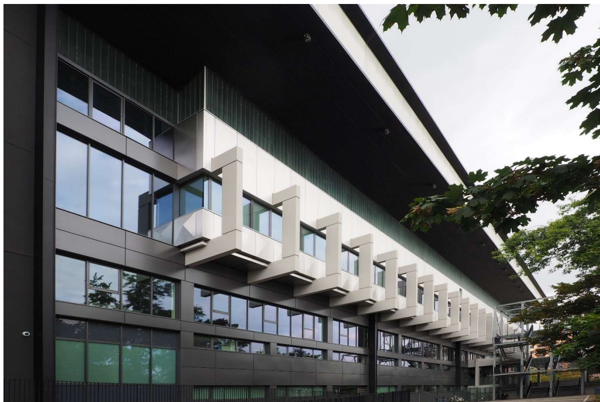
Légende : Centre nautique de Schiltigheim – Architecte : Rey-Lucquet et associés atelier d'architecture