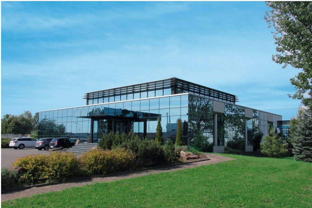
Légende : Siège social SOCOMAL - Reichstett

Une relation de proximité et de confiance avec nos partenaires et clients, c'est aussi cela l'expertise SOCOMAL.